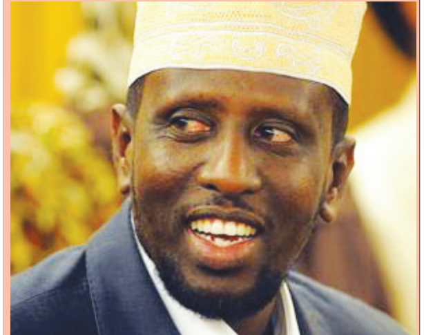
Madaxweynaha Soomaaliya Shariif Sheikh Axmed