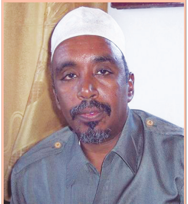
Guddoomiyaha Baarlamaanka Soomaaliya, Shariif Xasan Sheikh Aadan