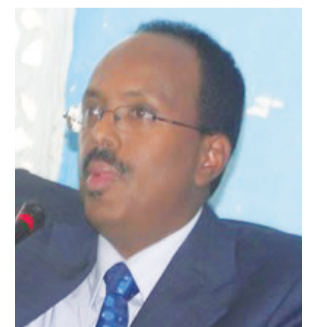
Ra'isul wasaare Farmaajo gobolladaasi in ay ku waaraan nabad, kuna xalistaan arrimahooda dariiq na-badeed iyo wada hadal.

cusboonaadeen maalmihii ugu danbeeyey, wuxuuna ugu baaqay in lagu xaliyo dhibaataada geed hoostiisa sidii caadada u ahayd Soomaalida, wuxuu kaloo Mahanaq u jeediyey intii kaalinta ka qaadatay qaboojinta xiisadahaasi, gaar ahaan Mas'uuliyiinta Maamullada goboladaas, Xildhibaanada, Culimaa'udiinka, Oday dhaqameedyada, Haweenka iyo waxgaradka kale ee ku nool Magaalada Muqdisho iyo Gobollada Dhexe, isagoo u rajeyey dadka ku nool