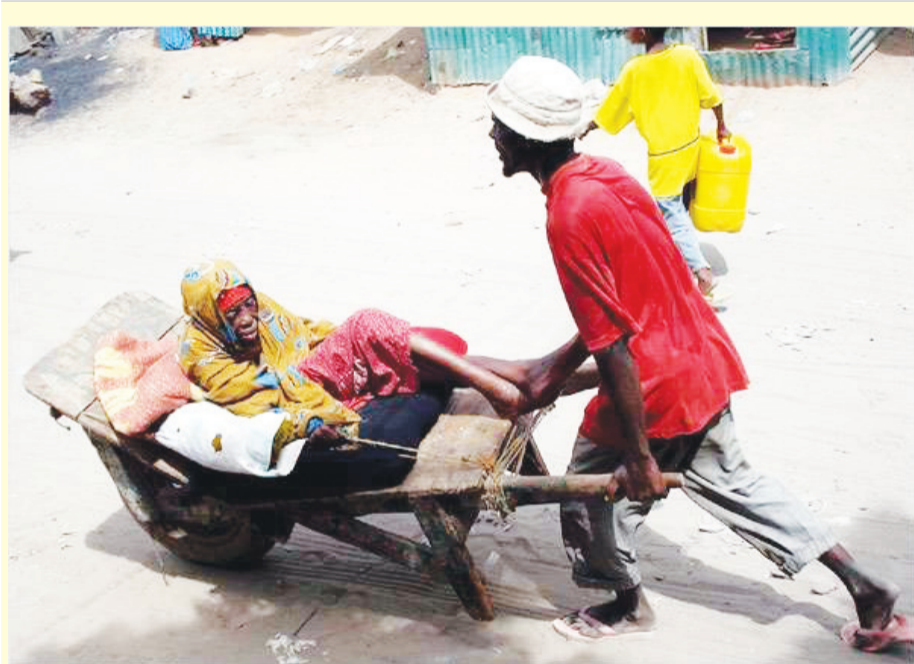
Gaarigacanluhu waxa uu qeyb ka qaatay daadgureynta dadka ay rasaastu haleeshay, Masawirka Haweeney da' ah oo waqti danbe ay haleeshay wi-ifta iyadoo gurigeeda joogta, waxaana loola cararaayaa mid ka mid ah xa-rumaha caafimaadka, inkastoo ay wadooyinka dhibaato kala kulmayaan.

Shacbiga Soomaaliyeed ee casiiska ah waxa uu maanta marayaa xaaladdii ugu xumayd, ee abid noloshiisa la soo gudboonaata, waxaa la soo dersay musiibooyin xukun Ilaahi ah, laakiin dadka caqli waaciga ah waxay in badan ka digeen in laga ilaaliyo bulshada Soomaaliyeed ku dhaqanka dhaqankeeda suuban, maxaa yeelay waxay meel fog ka arkeen in bulshada taasi ay u keenayso dhibaato, maanta taasi wey haysataa maxaa yeelay waxaa maqan awooddii shacbiga waxaa wiiqmay oo kala dhaltalimay midnimadii ummadda, taasoo la tilmaamo inay aasaas u tahay qabyaaladda. Haddaba, sidee looga gudbaa mashruucaasi? Maxaase la gudoob shacabka Soomaaliyeed si looga gudbo dhibaatooyinka jira, ee dib loogu soo celiyo inay u madaxbannaanaadaan dhaqankooda wanaagsan?