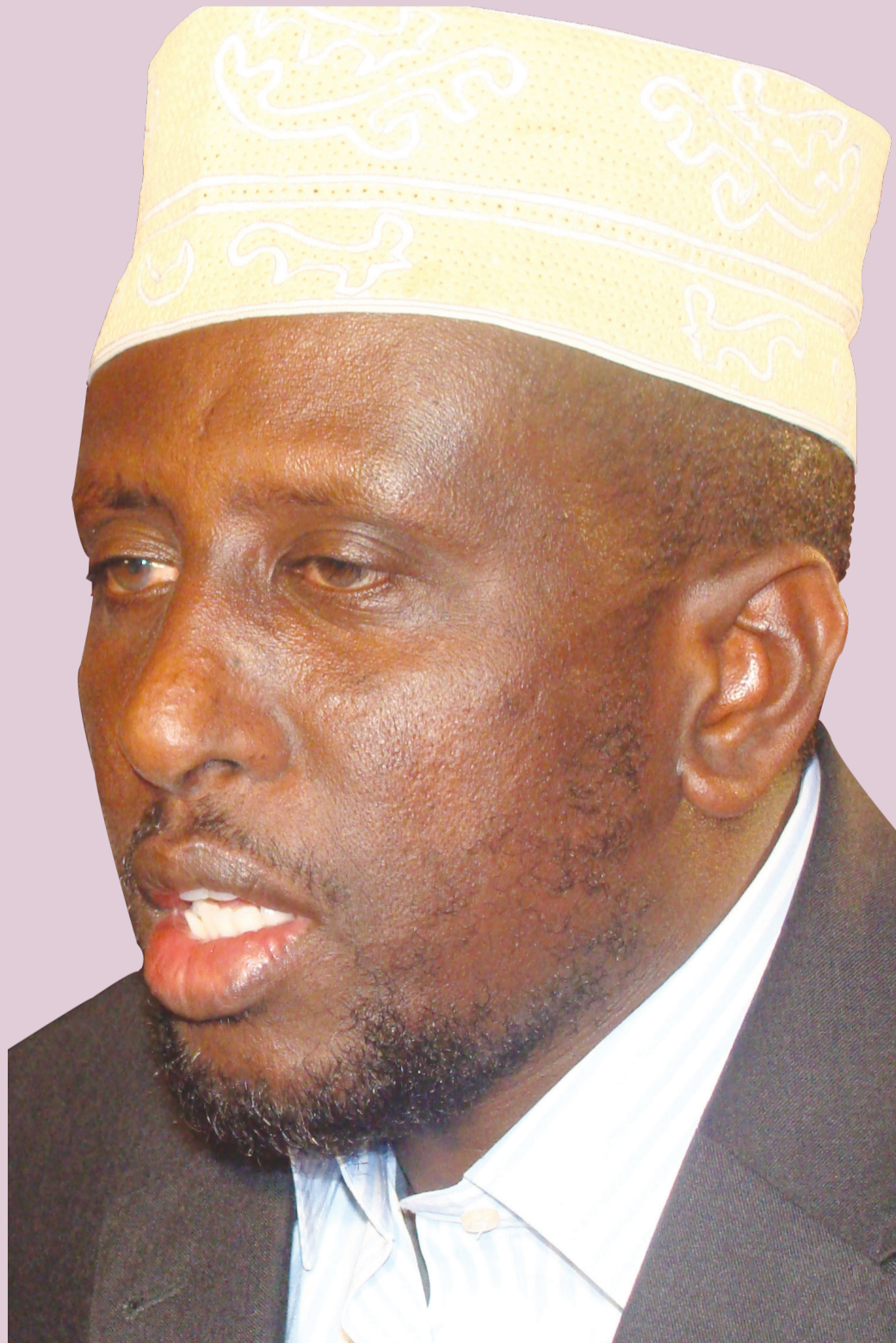
Mudane Sheekh Shariif: “Waa inaan ka faa’iidaysannaa fursadaan”.

“Shacbiga Soomaaliyeed dhibaato ayaa haysata, ma nasan karno inta ay dagaaladu socdaan, waxaan markaasi ugu baaqayaa xukuumada cusub in ay dhexda u xirato samatabixinta shacbiga Soomaaliyeed”, ayuu yiri Madaxweynaha oo intaasi ku daray in dhammaanteen looga baahan yahay in aan ka qeybqaadano sidii aan ula shaqeyn lahayn Ra'isul wasaaraha cusub, kaasoo looga baahan yahay in uu wajaho dhibaatooyinka la wajihi waayay.