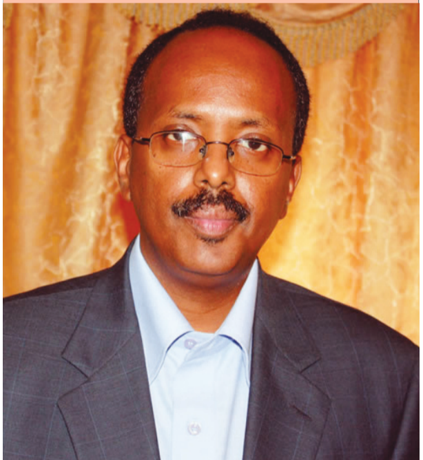
Ra'isul Wasaaraha Soomaaliya, Maxamed Cabdullaahi Maxamed